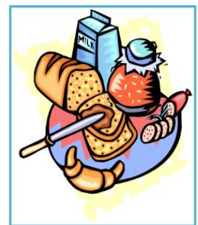
おいしく食べて 健康に！！