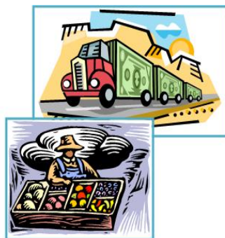
持続的な経済栽培を可能とする 管理技術の開発